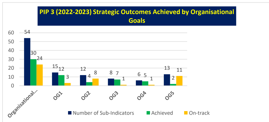
Illustration 4 : Résultats stratégiques du PIP2 : résultat par objectif organisationnel

OBJECTIF ORGANISATIONNEL 1 : Le PROE dispose de systèmes d'information, de connaissances et de communications qui fournissent les bonnes données aux bonnes personnes au bon moment et influencent positivement les changements organisationnels, comportementaux et environnementaux.